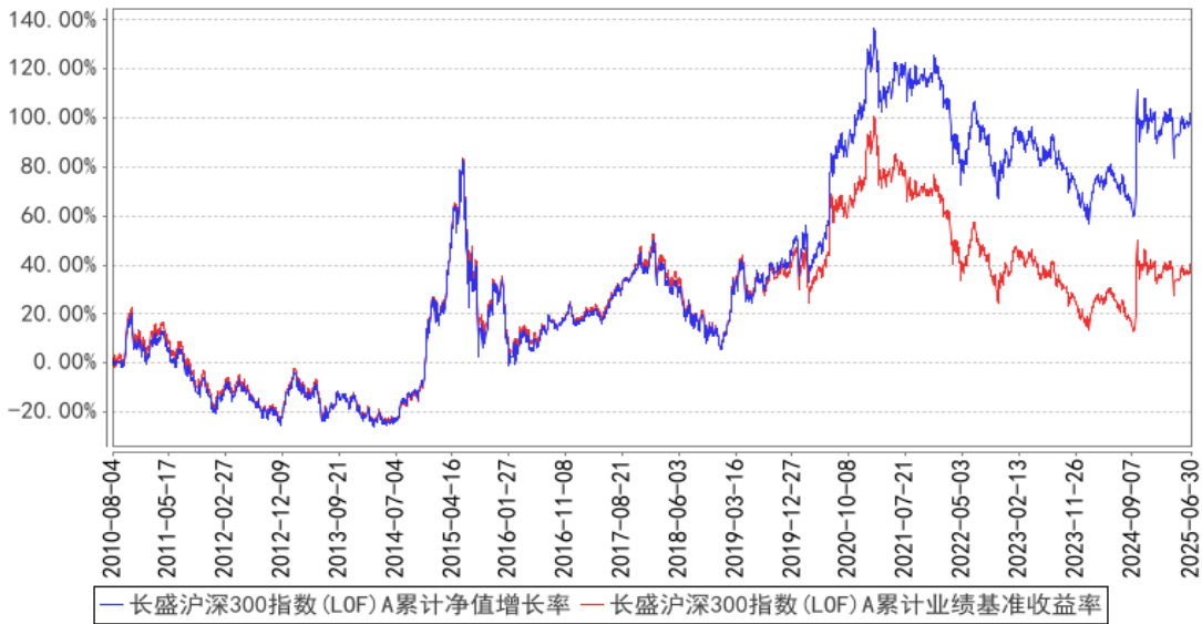
长盛沪深300指数(LOF)A累计净值增长率与同期业绩比较基准收益率的历史走势对比图

由于基金资产配置比例处于动态变化的过程中，需要通过再平衡来使资产的配置比例符合基金合同要求，基准指数每日按照 95%、5%的比例采取再平衡，再用连锁计算的方式得到基准指数的时间序列。