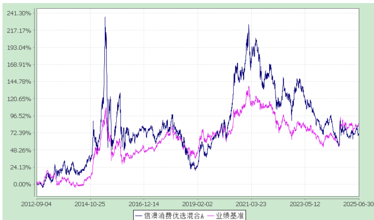
信澳消费优选混合 C 累计净值增长率与业绩比较基准收益率的历史走势对比图