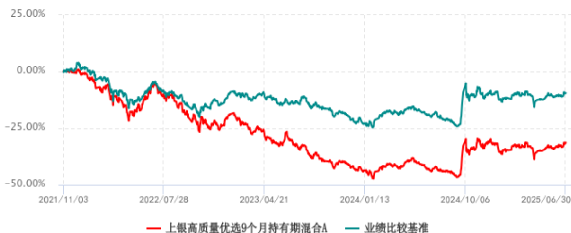
上银高质量优选9个月持有期混合C累计净值增长率与业绩比较基准收益率历史走势对比图