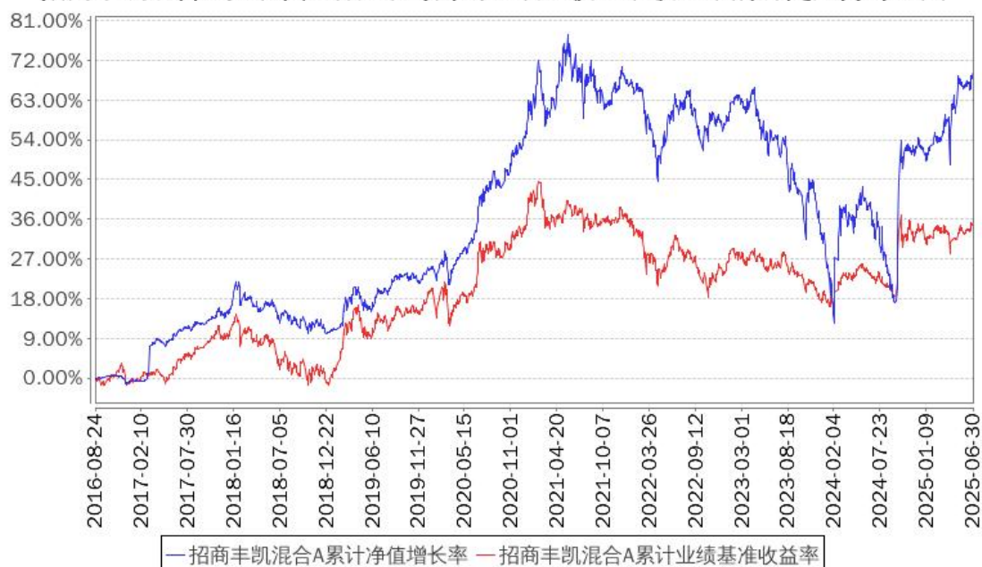
招商丰凯混合A累计净值增长率与同期业绩比较基准收益率的历史走势对比图