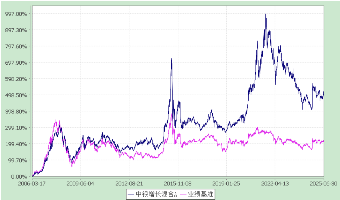
中银持续增长混合型证券投资基金 累计净值增长率与业绩比较基准收益率的历史走势对比图 (2006 年 3 月 17 日至 2025 年 6 月 30 日)