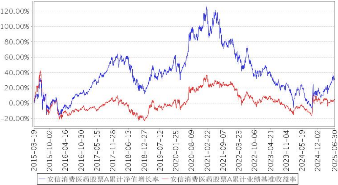
安信消费医药股票A累计净值增长率与同期业绩比较基准收益率的历史走势对比图