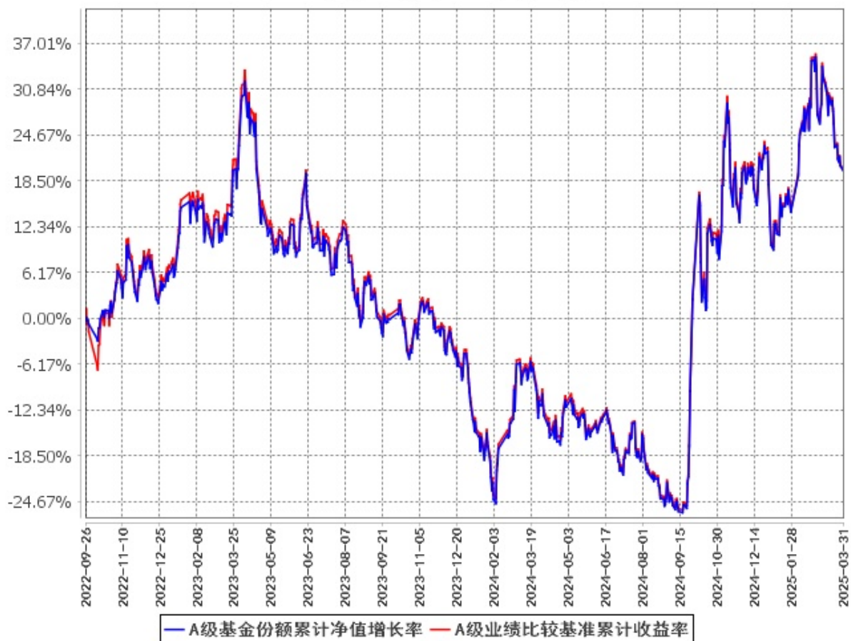
A级基金份额累计净值增长率与同期业绩比较基准收益率的历史走势对比图 (2022年9月26日至2025年3月31日)