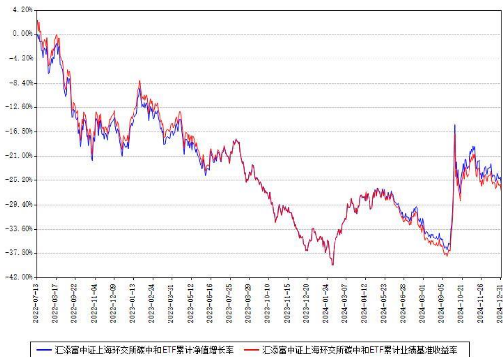
汇添富中证上海环交所碳中和ETF累计净值增长率与同期业绩基准收益率对比图

注：本基金建仓期为本《基金合同》生效之日（2022 年 07 月 13 日）起 6 个月，建仓期结束时各项资产配置比例符合合同约定。