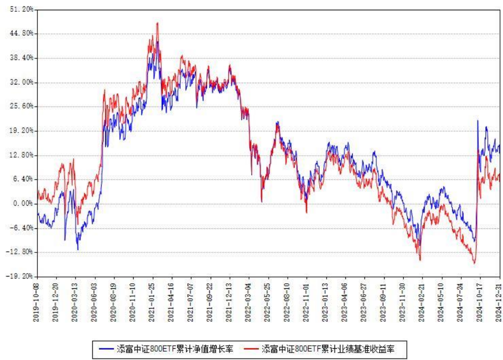
添富中证800ETF累计净值增长率与同期业绩基准收益率对比图

注：本基金建仓期为本《基金合同》生效之日（2019 年 10 月 08 日）起 6 个月，建仓期结束时各项资产配置比例符合合同约定。