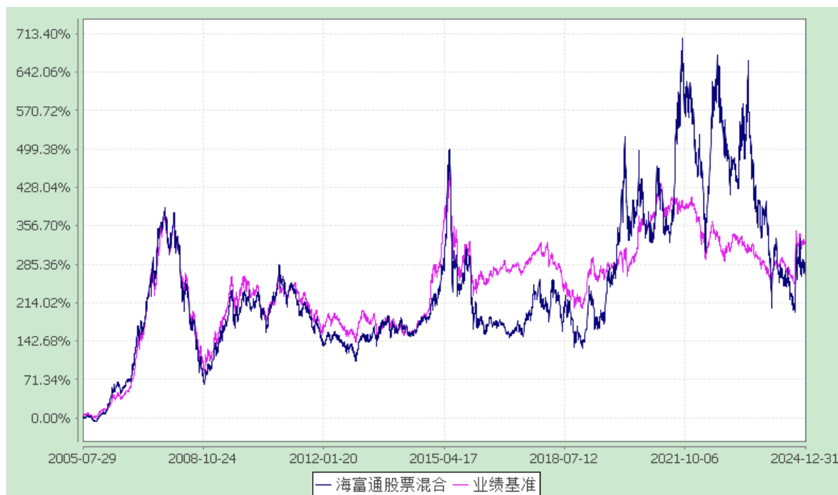
海富通股票混合型证券投资基金 份额累计净值增长率与业绩比较基准收益率的历史走势对比图 (2005 年 7 月 29 日至 2024 年 12 月 31 日)

注：1、按基金合同规定，本基金自基金合同生效起 6 个月内为建仓期。本基金自 2007 年 8 月 22 日至 2007 年 11 月 23 日为持续营销后建仓期。建仓期满至今本基金的各项投资比例已达到基金合同第 14 章（二）关于投资范围的规定；同时满足第 14 章（七）有关投资组合限制的各项比例要求。