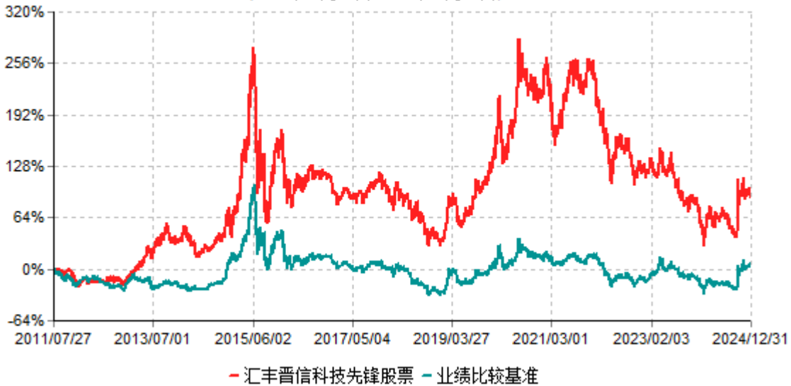
汇丰晋信科技先锋股票累计净值增长率与业绩比较基准收益率历史走势对比图 (2011年07月27日-2024年12月31日)