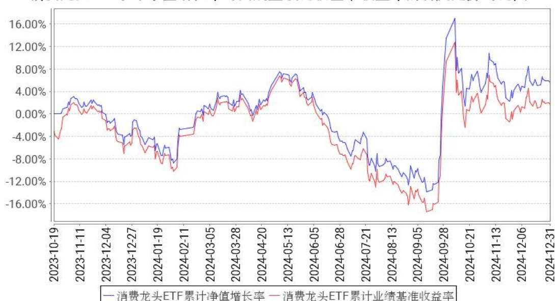
消费龙头ETF累计净值增长率与同期业绩比较基准收益率的历史走势对比图