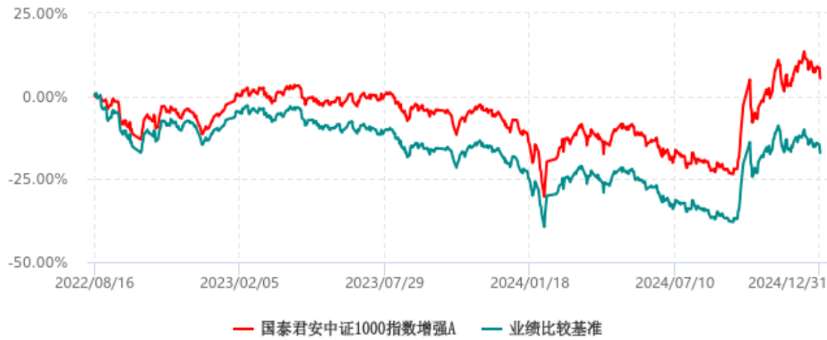
国泰君安中证1000指数增强C累计净值增长率与业绩比较基准收益率历史走势对比图