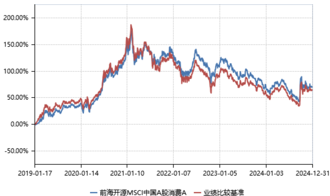
前海开源 MSCI 中国 A 股消费 C