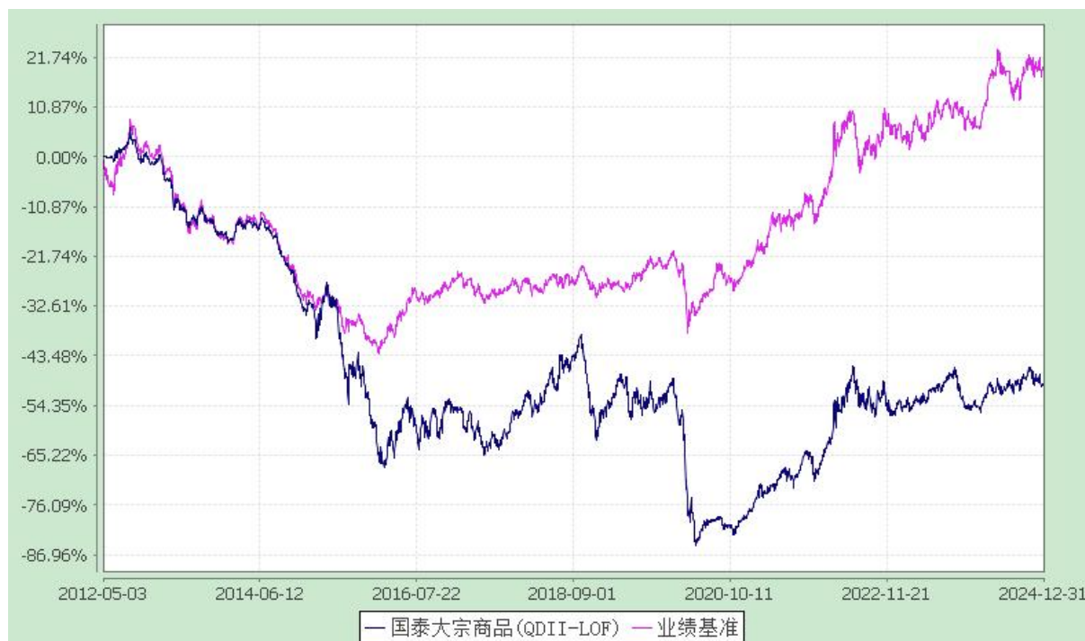
国泰大宗商品配置证券投资基金(LOF) 份额累计净值增长率与业绩比较基准收益率历史走势对比图 (2012年5月3日至2024年12月31日)