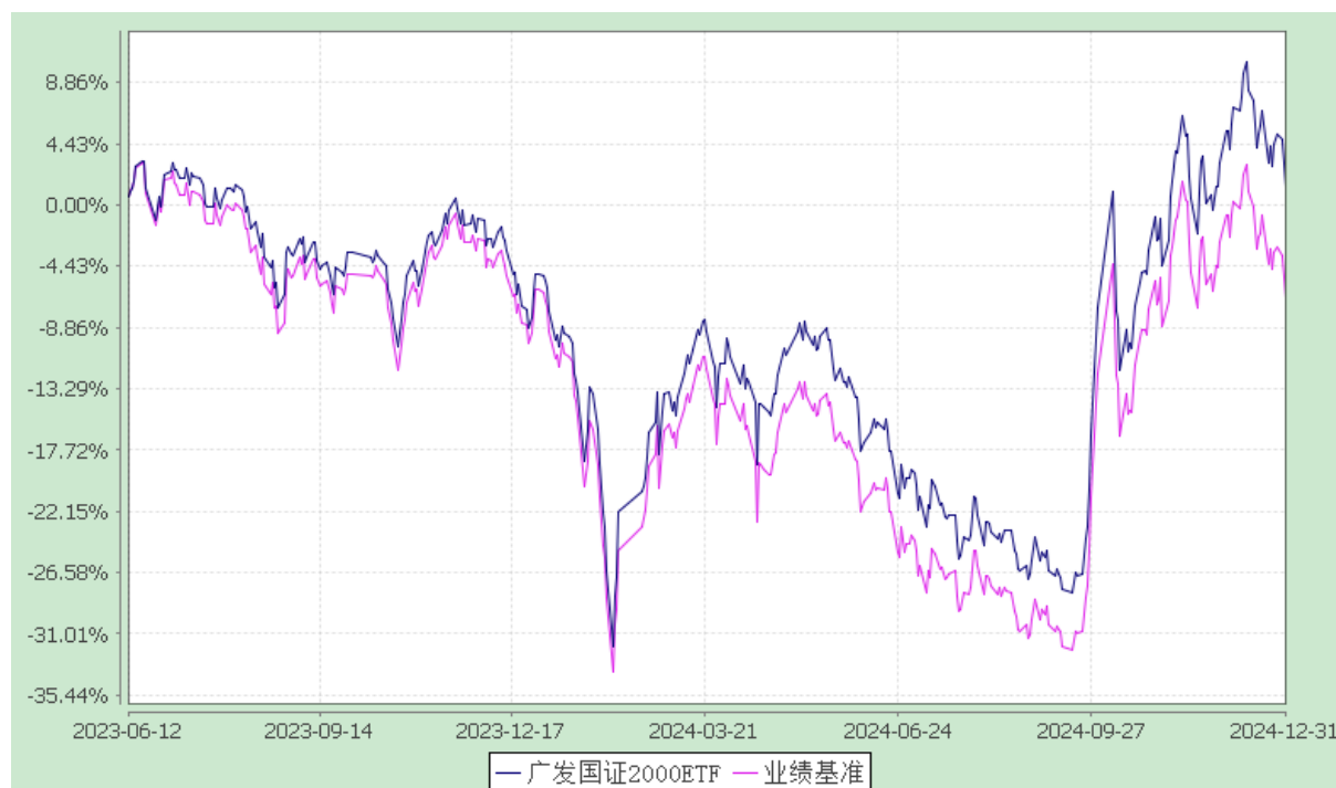
广发国证 2000 交易型开放式指数证券投资基金 份额累计净值增长率与业绩比较基准收益率的历史走势对比图 (2023 年 6 月 12 日至 2024 年 12 月 31 日)

注：本基金于 2023 年 6 月 12 日正式转型为广发国证 2000 交易型开放式指数证券投资基金。