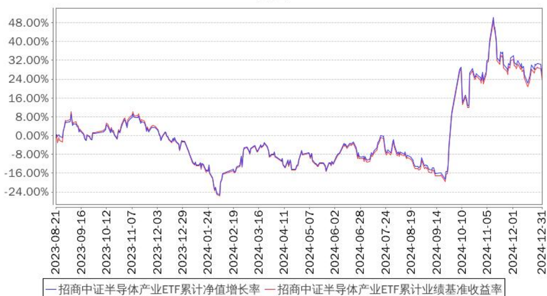
招商中证半导体产业ETF累计净值增长率与同期业绩比较基准收益率的历史走势对比图