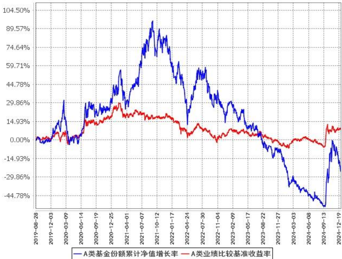
A类基金份额累计净值增长率与同期业绩比较基准收益率的历史走势对比图 (2019年8月28日至2024年12月31日)