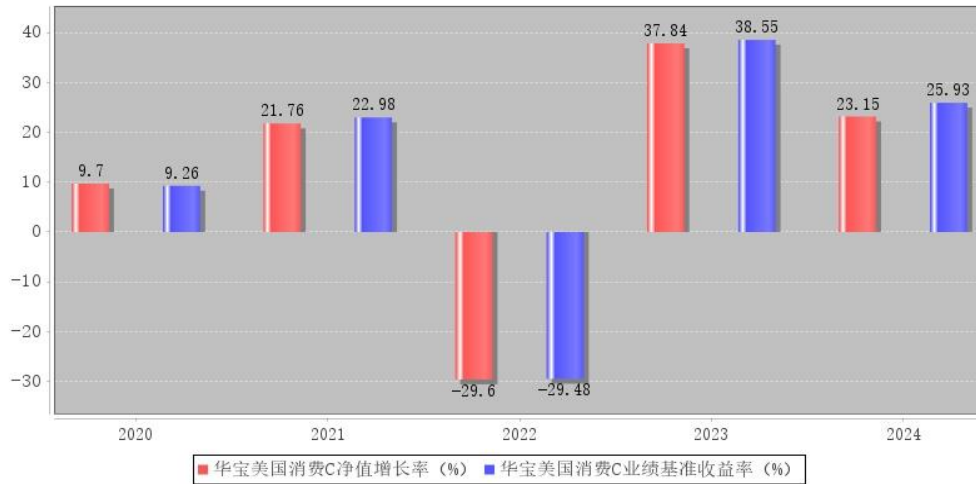
华宝美国消费C每年净值增长率与同期业绩比较基准收益率的对比图