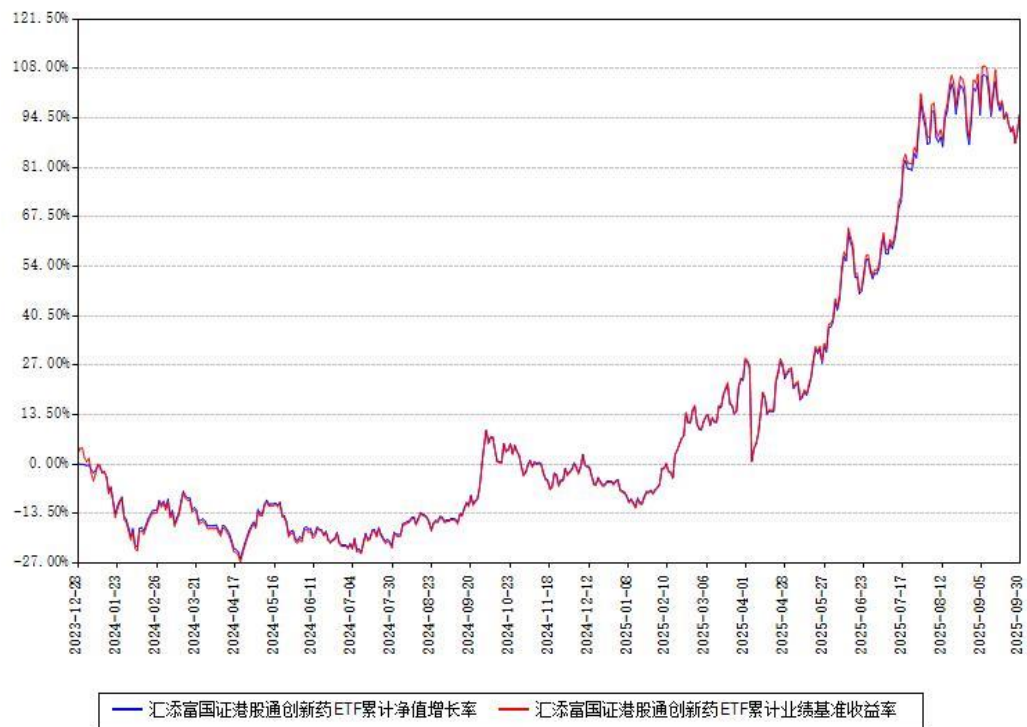
汇添富国证港股通创新药ETF累计净值增长率与同期业绩基准收益率对比图