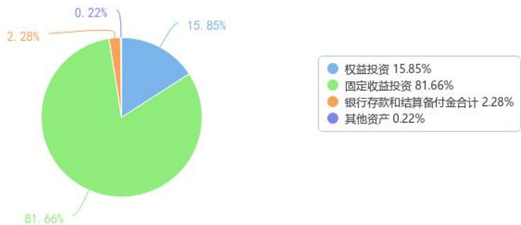
投资组合资产配置图表（数据截至日期：2025年09月30日）