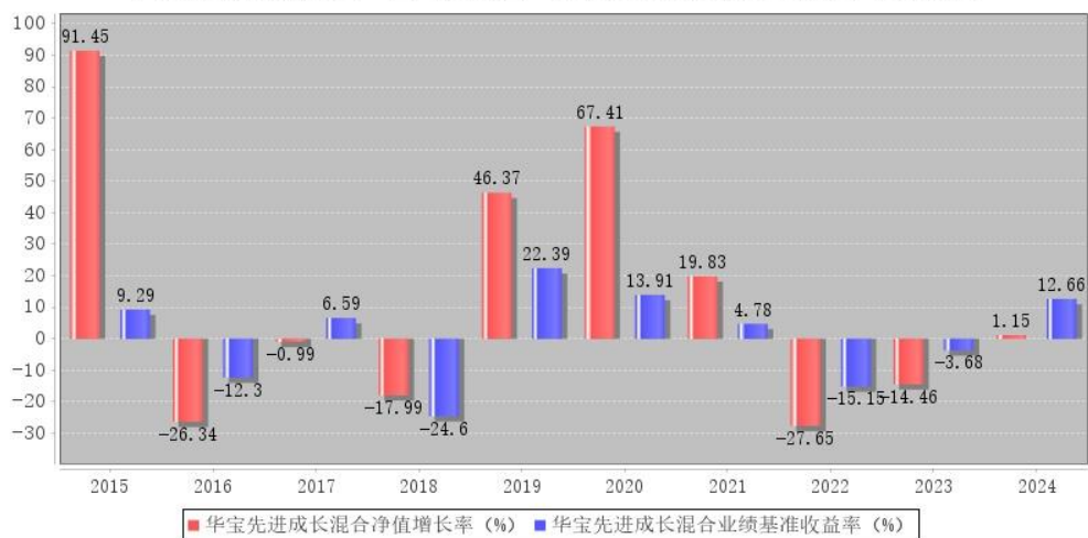
华宝先进成长混合每年净值增长率与同期业绩比较基准收益率的对比图