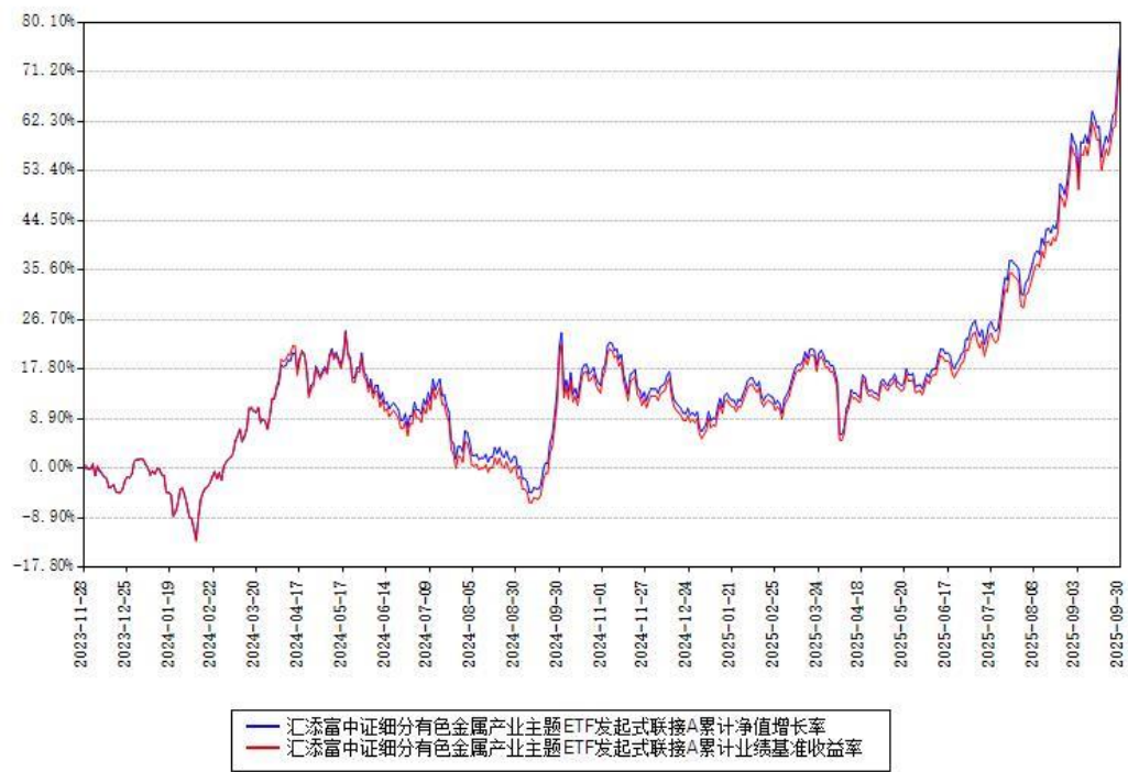
汇添富中证细分有色金属产业主题ETF发起式联接A累计净值增长率与同期业绩基准收益率对比图