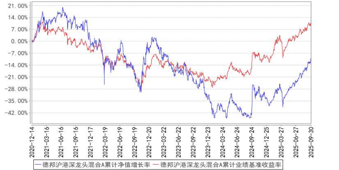
德邦沪港深龙头混合A累计净值增长率与同期业绩比较基准收益率的历史走势对比图

注：本基金业绩比较基准：恒生指数收益率×60%+中证全债指数收益率×30%+沪深 300 指数收益率×10%。