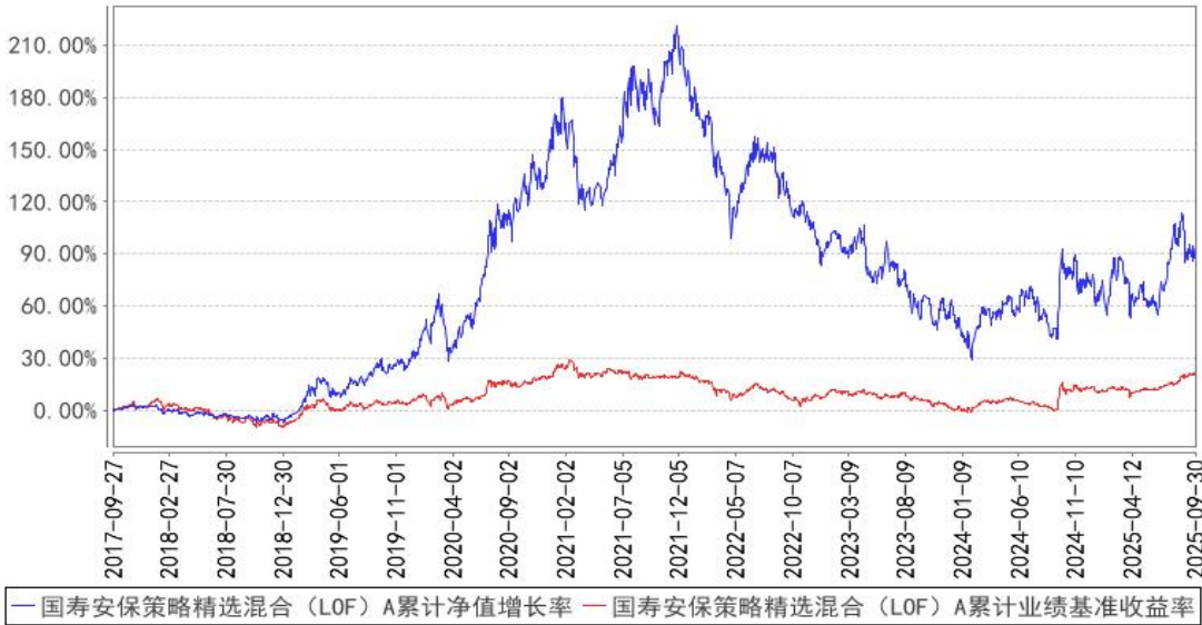
国寿安保策略精选混合（LOF）A 累计净值增长率与同期业绩比较基准收益率的历史 走势对比图