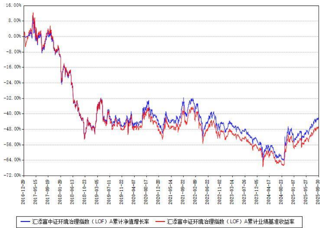
汇添富中证环境治理指数（LOF）A累计净值增长率与同期业绩比较基准收益率对比图