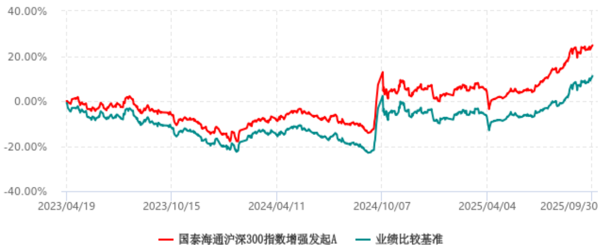
国泰海通沪深300指数增强发起A累计净值增长率与业绩比较基准收益率历史走势对比图 (2023年04月19日-2025年09月30日)