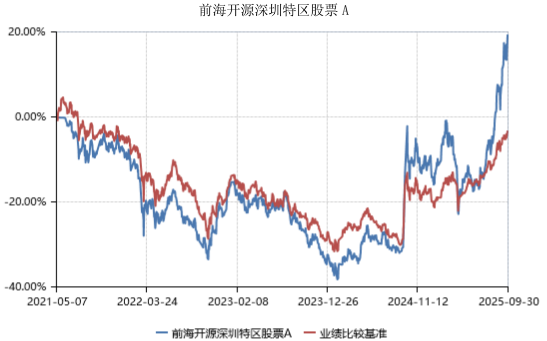
前海开源深圳特区股票 C