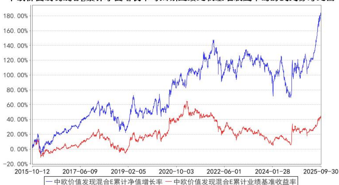
中欧价值发现混合E累计净值增长率与同期业绩比较基准收益率的历史走势对比图

注：自 2015 年 10 月 8 日起, 本基金增加 E 类份额，图示日期为 2015 年 10 月 12 日至 2025 年 09 月 30 日。