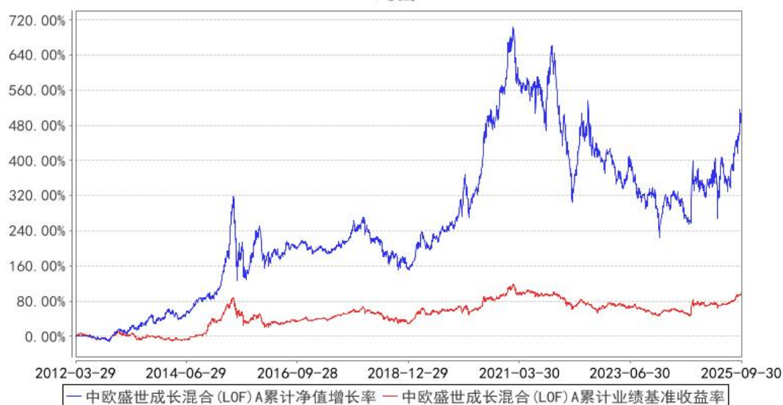
中欧盛世成长混合(LOF) A 累计净值增长率与同期业绩比较基准收益率的历史走势对比图