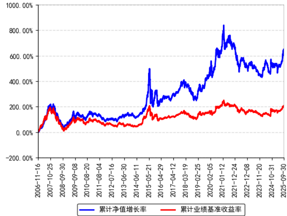
南方绩优成长混合A累计净值增长率与同期业绩比较基准收益率的历史走势对比图