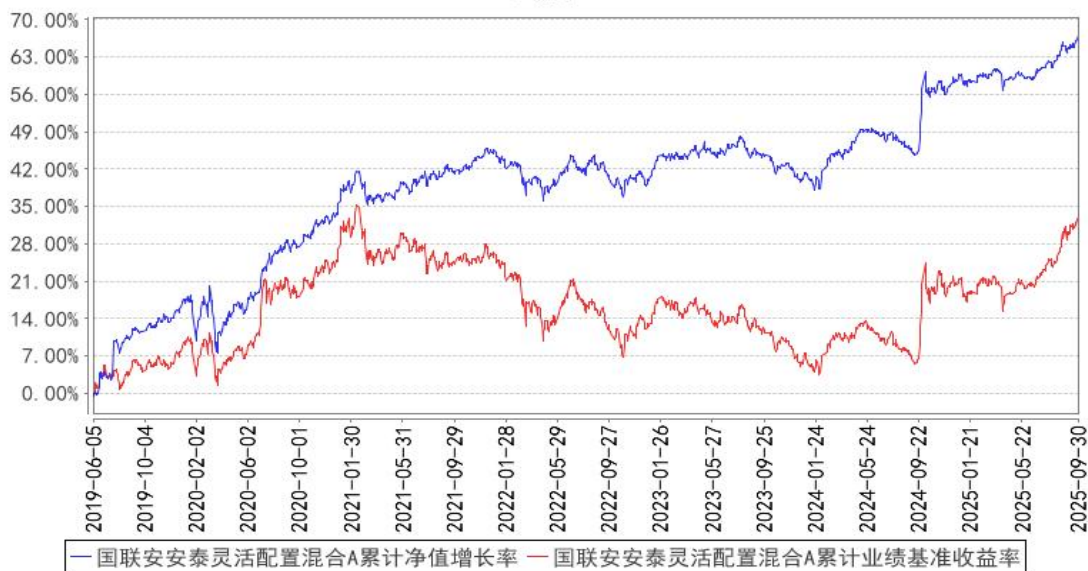
国联安安泰灵活配置混合A累计净值增长率与同期业绩比较基准收益率的历史走势对比图

注：1、国联安安泰灵活配置混合型证券投资基金于 2025 年 7 月 17 日起增加收取销售服务费的 C 类基金份额，并对本基金基金合同及托管协议作相应修改，原有的基金份额在增加收取销售服务费的 C 类基金份额后，全部自动转换为国联安安泰灵活配置混合型证券投资基金 A 类份额；