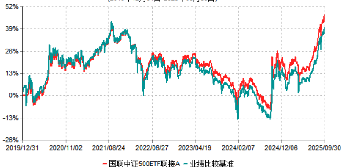
国联中证500ETF联接A累计净值增长率与业绩比较基准收益率历史走势对比图 (2019年12月31日-2025年09月30日)