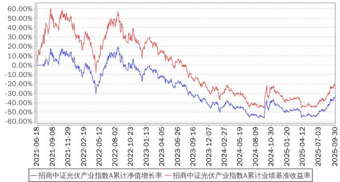
招商中证光伏产业指数A累计净值增长率与同期业绩比较基准收益率的历史走势对比图