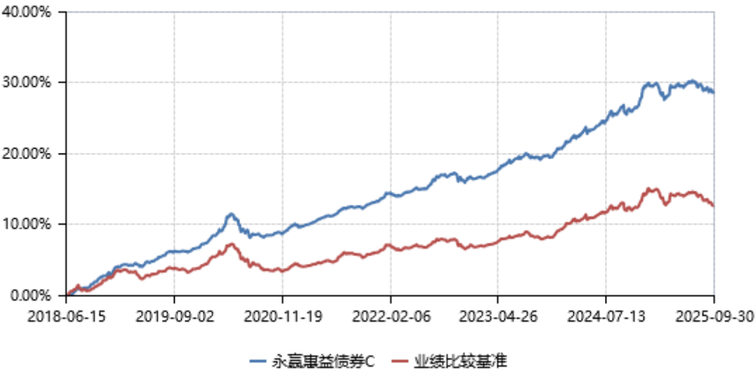
永赢惠益债券C累计净值收益率与业绩比较基准收益率历史走势对比图 (2018年06月15日-2025年09月30日)