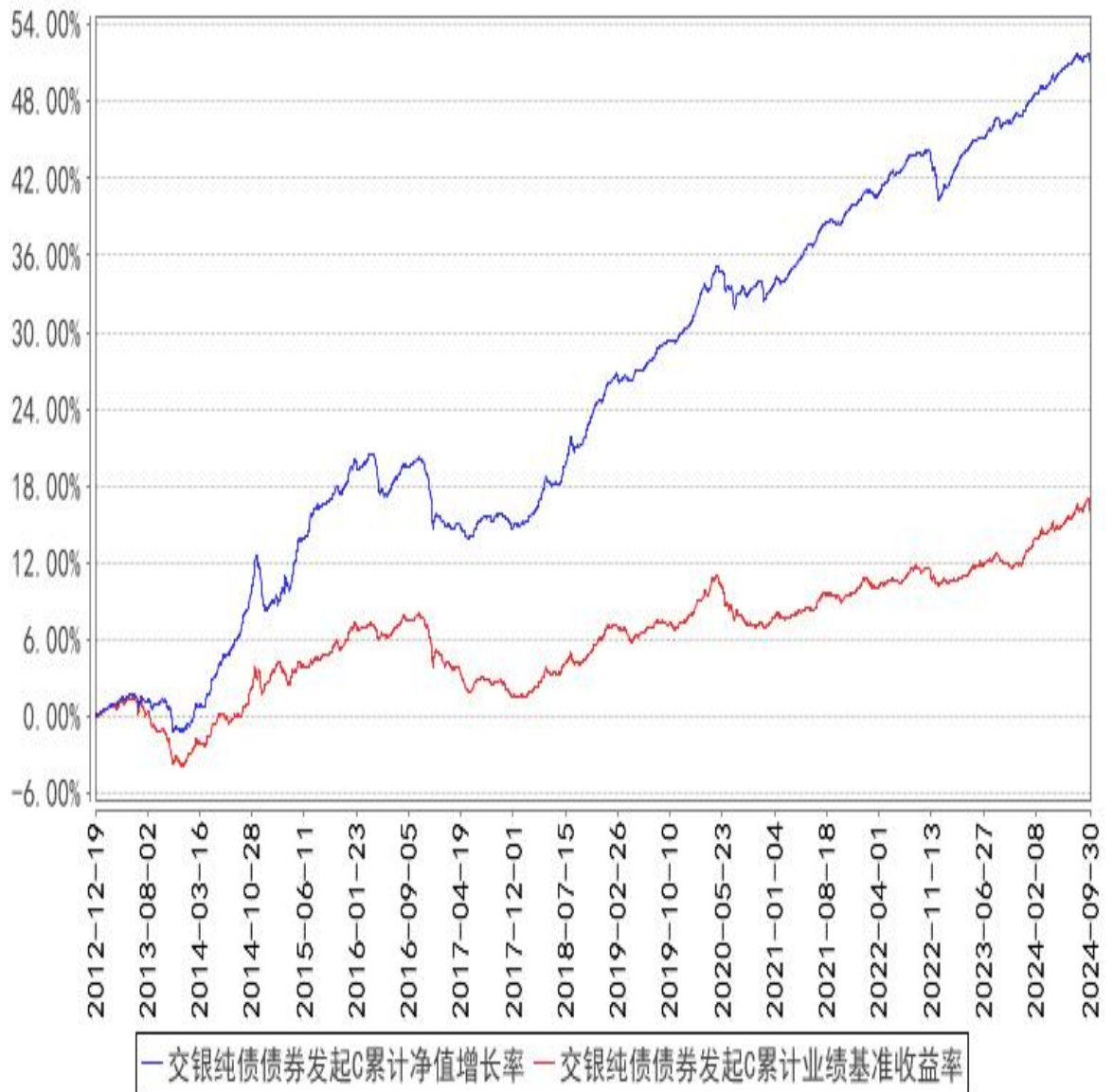
交银纯债债券发起C累计净值增长率与同期业绩比较基准收益率的历史走势对比图

注：本基金建仓期为自基金合同生效日起的6个月。截至建仓期结束，本基金各项资产配置比例符合基金合同及招募说明书有关投资比例的约定。