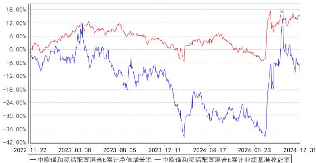
中欧瑾和灵活配置混合E累计净值增长率与同期业绩比较基准收益率的历史走势对比图

注：本基金于 2022 年 11 月 21 日新增 E 类份额，图示日期为 2022 年 11 月 22 日至 2024 年 12 月 31 日。