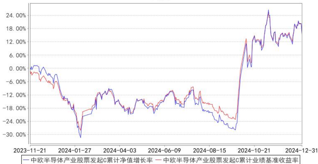
中欧半导体产业股票发起C累计净值增长率与同期业绩比较基准收益率的历史走势对比图

注：本基金基金合同生效日期为 2023 年 11 月 21 日，按基金合同的规定，本基金自基金合同生效之日起六个月为建仓期，建仓期结束时各项资产配置比例已经符合基金合同约定。