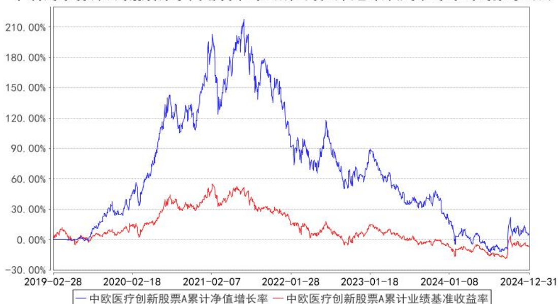
中欧医疗创新股票A累计净值增长率与同期业绩比较基准收益率的历史走势对比图