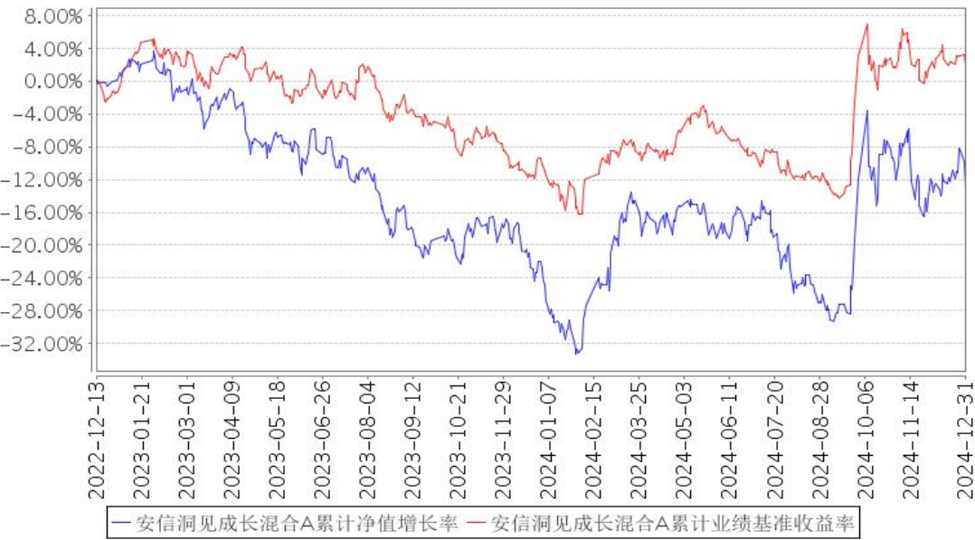
安信洞见成长混合A累计净值增长率与同期业绩比较基准收益率的历史走势对比图