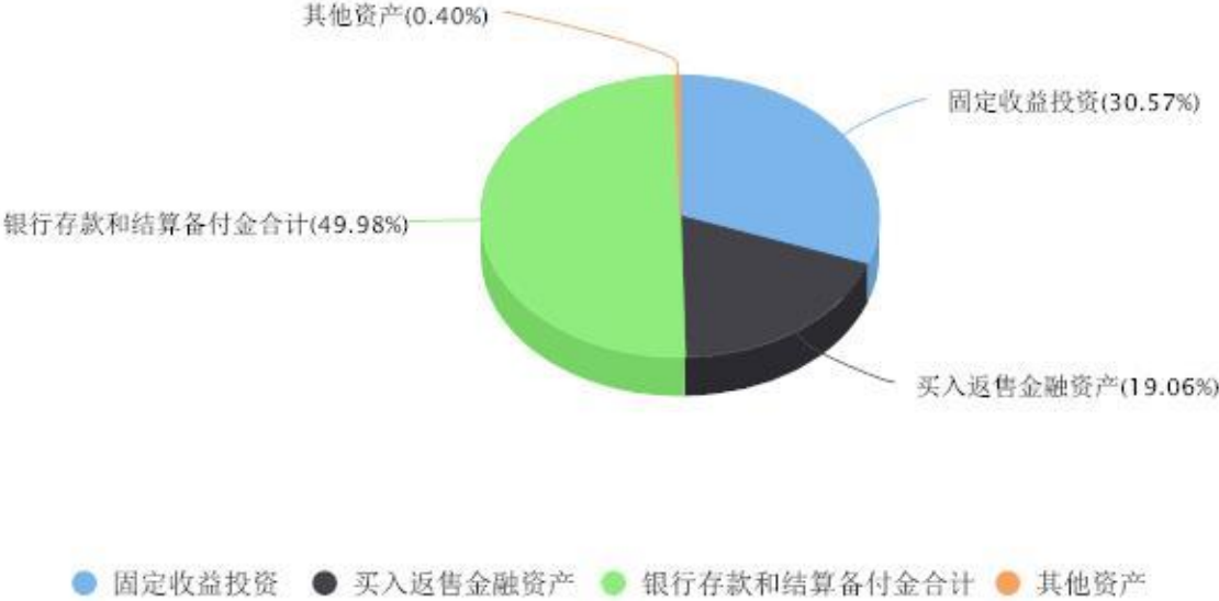
投资组合资产配置图表 数据截止日期:2024年09月30日