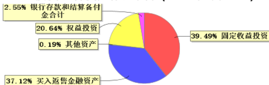
投资组合资产配置图表(2024年6月30日)

● 固定收益投资 ● 买入返售金融资产 ● 其他资产 ● 权益投资 ● 银行存款和结算备付金合计