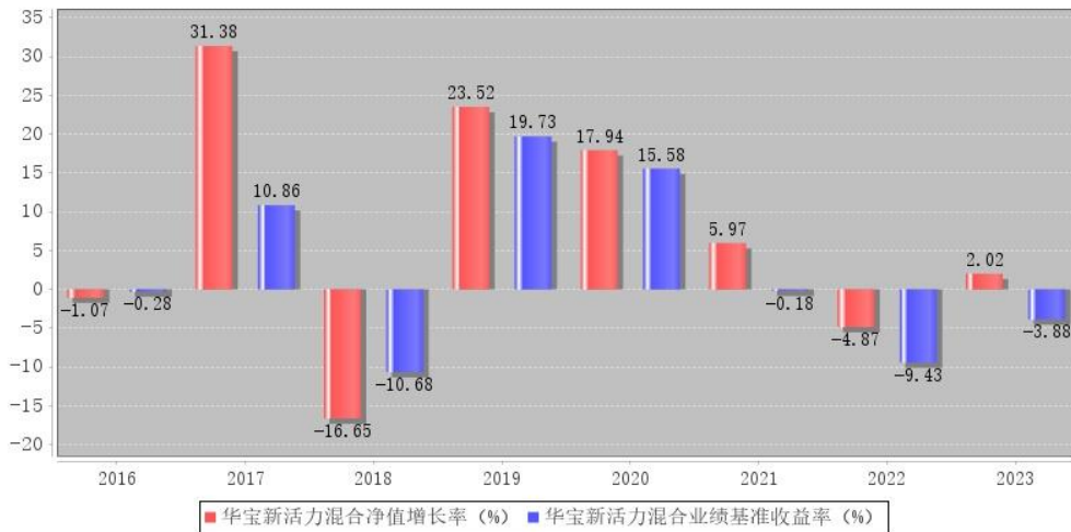
华宝新活力混合每年净值增长率与同期业绩比较基准收益率的对比图