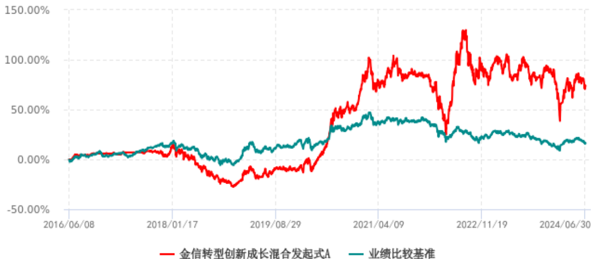
金信转型创新成长混合发起式A累计净值增长率与业绩比较基准收益率历史走势对比图 (2016年06月08日-2024年06月30日)