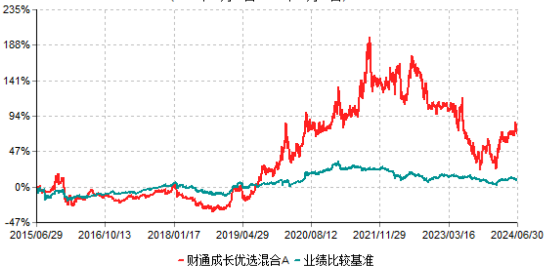
财通成长优选混合A累计净值增长率与业绩比较基准收益率历史走势对比图 (2015年06月29日-2024年06月30日)