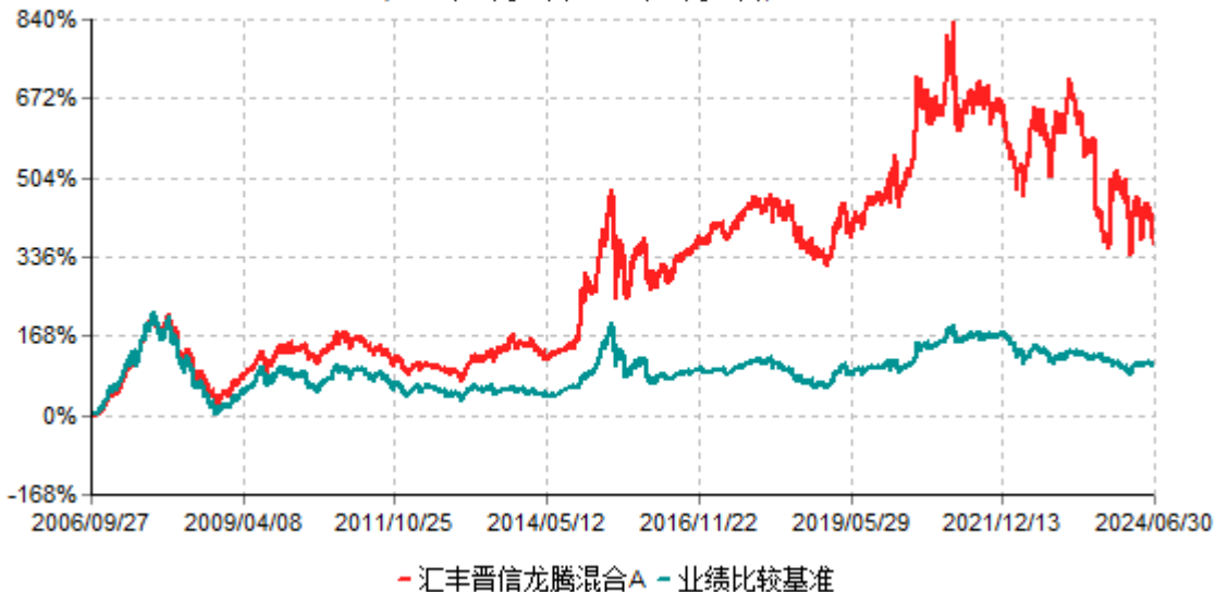
汇丰晋信龙腾混合A累计净值增长率与业绩比较基准收益率历史走势对比图 (2006年09月27日-2024年06月30日)