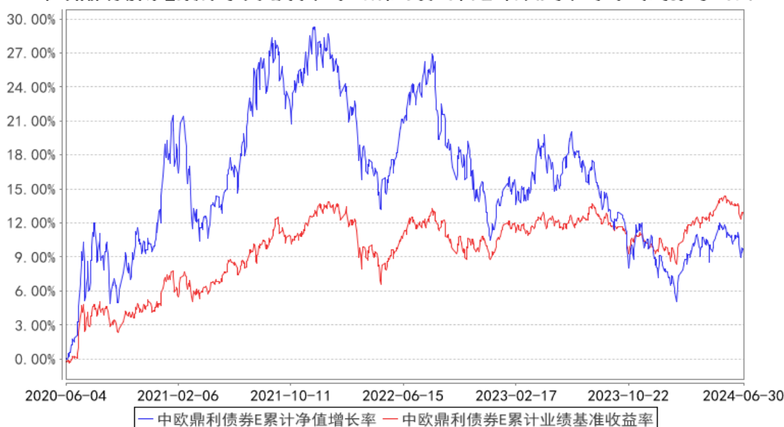
中欧鼎利债券E累计净值增长率与同期业绩比较基准收益率的历史走势对比图

注：自 2020 年 6 月 3 日起，本基金增加 E 类份额，同日起，本基金业绩比较基准由“中国债券总值指数收益率*90%+沪深 300 指数收益率*10%”变更为“中证 800 指数收益率*15%+中证可转换债券指数*25%+中债综合财富指数收益率*60%”。图示日期为 2020 年 6 月 4 日至 2024 年 06 月 30 日。