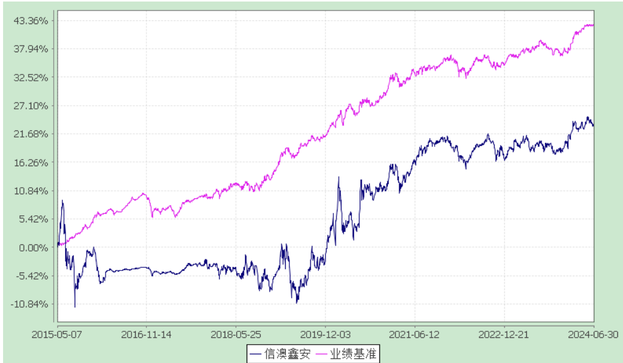
信澳鑫安债券 C 累计净值增长率与业绩比较基准收益率的历史走势对比图