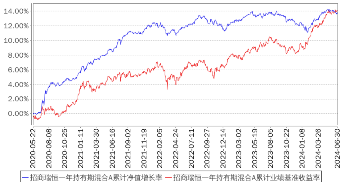
招商瑞恒一年持有期混合A累计净值增长率与同期业绩比较基准收益率的历史走势对比图