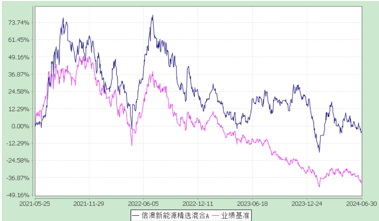
信澳新能源精选混合 C 累计净值增长率与业绩比较基准收益率的历史走势对比图